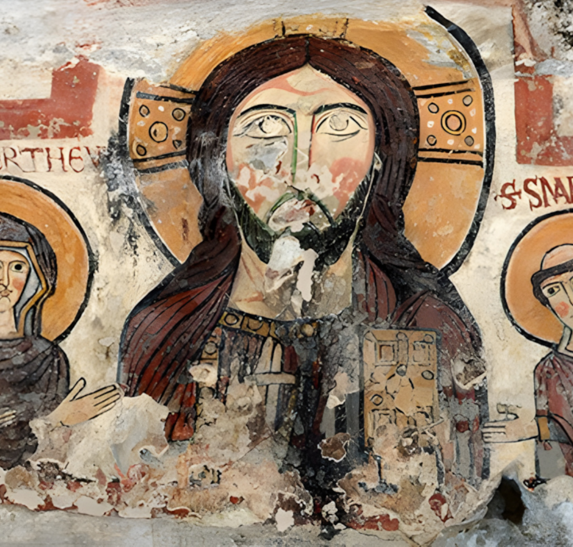
CRISTO PANTOCRATORE, Catacombe di San Senatore, Albano Laziale