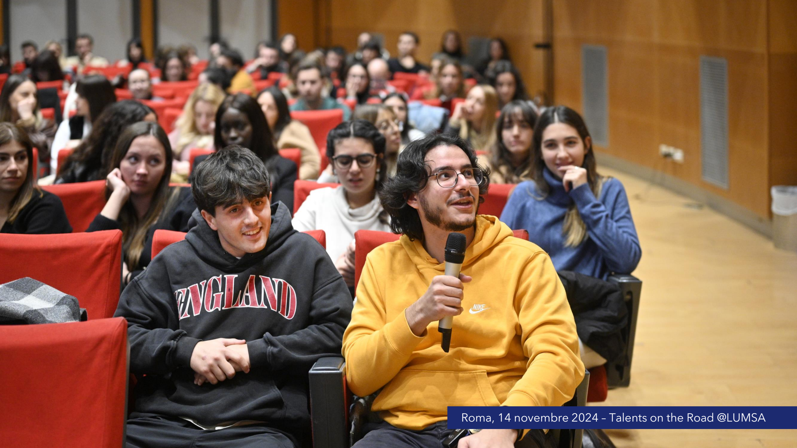
Roma, 14 novembre 2024 - Talents on the Road @LUMSA