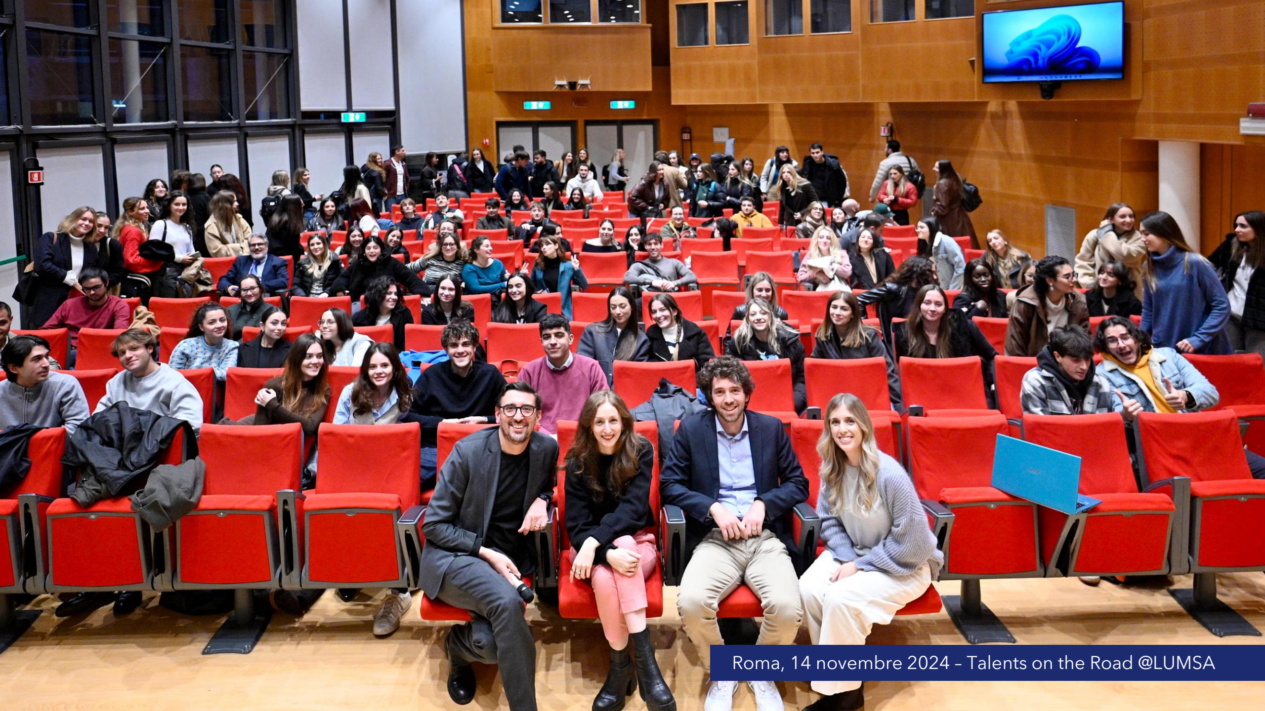
Roma, 14 novembre 2024 - Talents on the Road @LUMSA