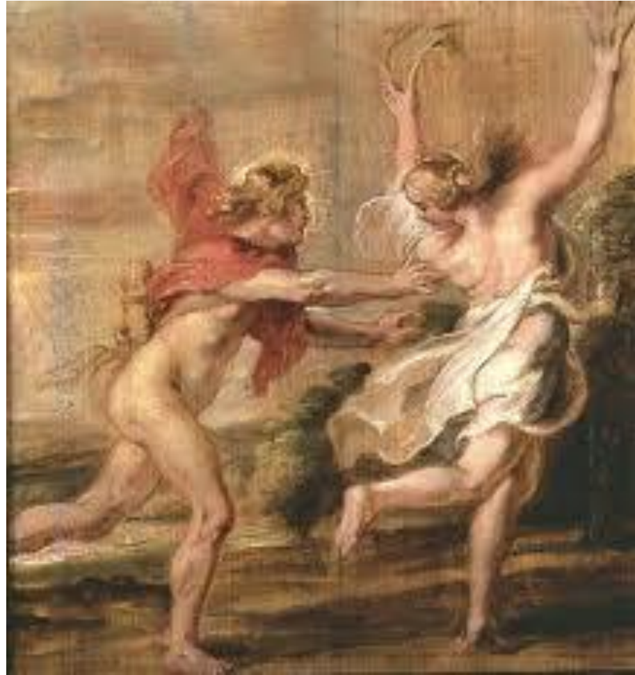
Rubens: Apollo e Dafne

Over-stalking: quando la persecuzione diventa omicidio